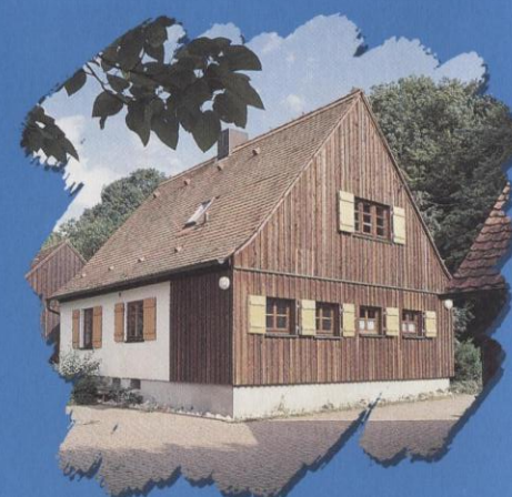
FREIZEITHAUS FÜLLMENBACHER HOF